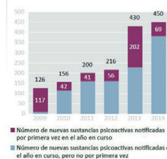
Número de nuevas sustancias psicoactivas notificadas al sistema de alerta temprana de la Oficina de las Naciones Unidas contra la Droga y el Delito, 2009-2014

Fuente: UNODC, sistema de alerta temprana sobre nuevas sustancias psicoactivas, 2009-2014.