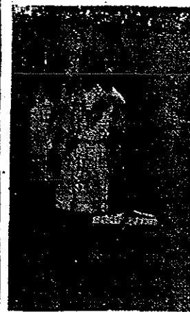
Instante en que hace entrada la nueva Bandera de Ceremonias en la Escuela N° 61 en Barrio Alciara de la ciudad de Bernal.